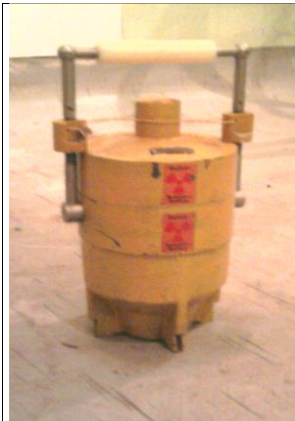
37. Sugárforrás tartó (Cs-137) a