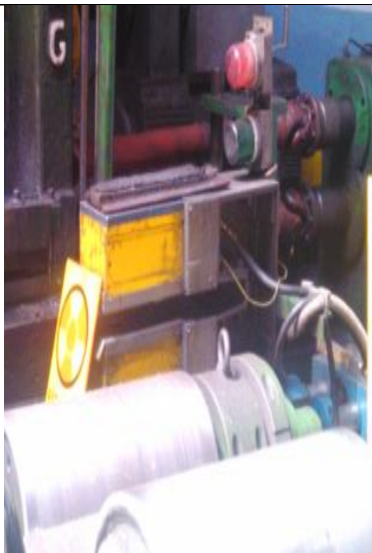
24. Vastagságmérő (Am-241) a