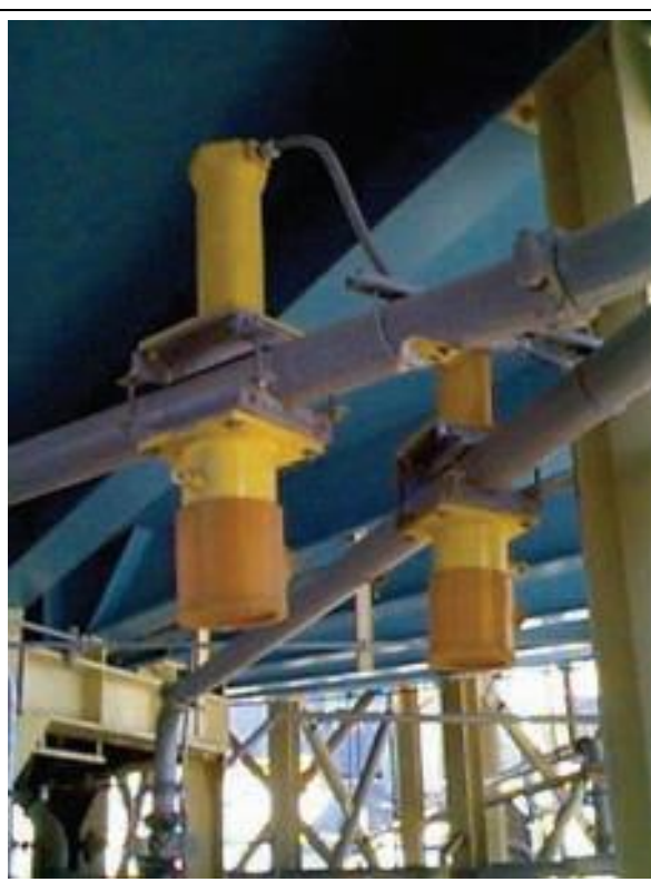
22. Tömegáram mérő sugárforrás tartó (Cs-137) b