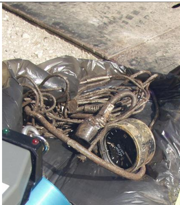
2. Műszer számlap (Ra-226) a