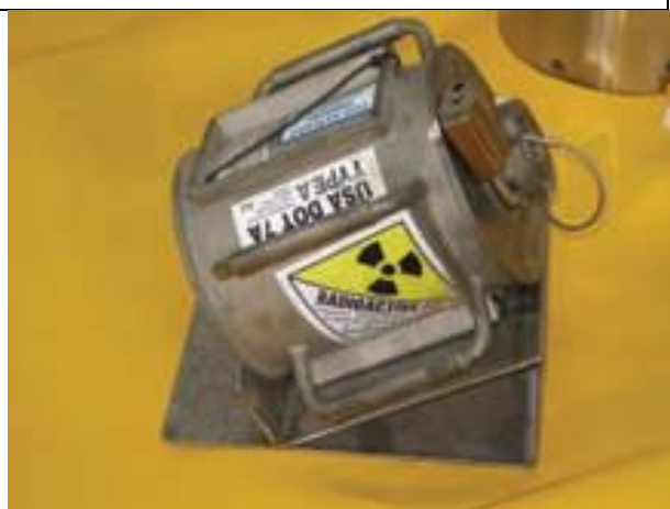
28. Talajszonda sugárforrás szállító tartó (Cs-137) b