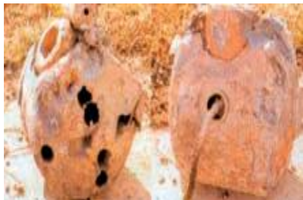
45. Terápiás besugárzó fej (Cs-137 / Co-60) b