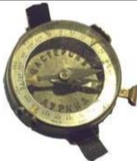
6. Kézi tájoló (Ra-226) a