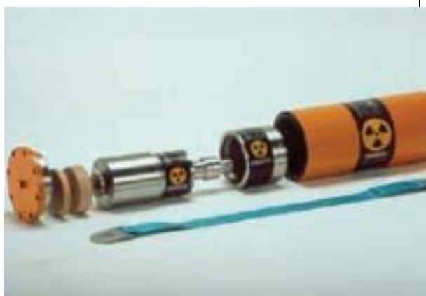
35. Gamma radiográfia „csőben járó” (Ir-192) b