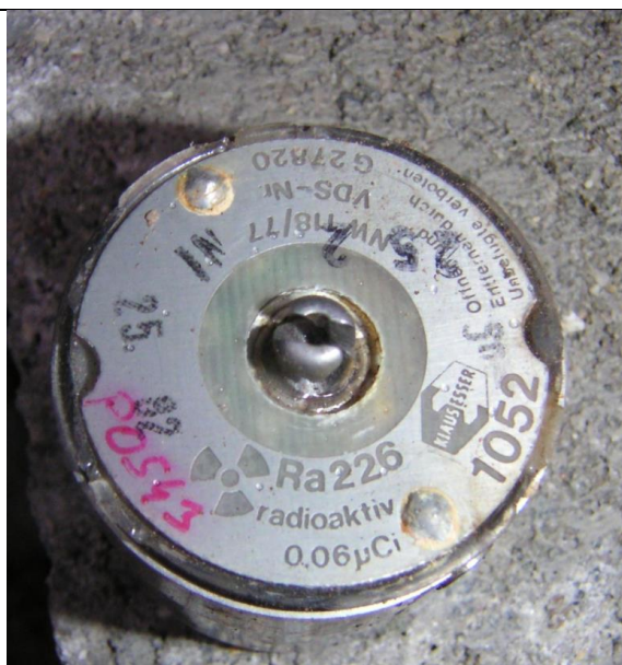
10. Füstérzékelő (Ra-226) a