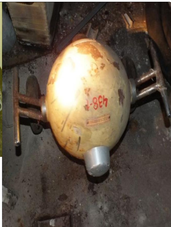
30. Zárt sugárforrás tartó (Cs-137) a