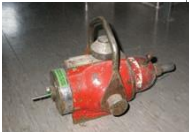
33. Gamma radiográfia munkatartó (Co-60) b