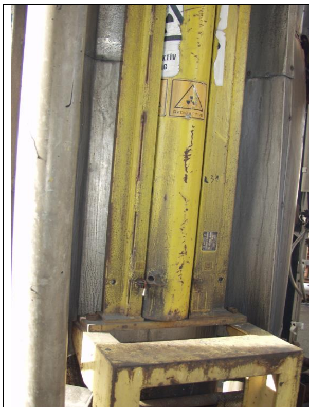
21. Töltésszint jelző munkatartó (vonalforrás, Co-60) a