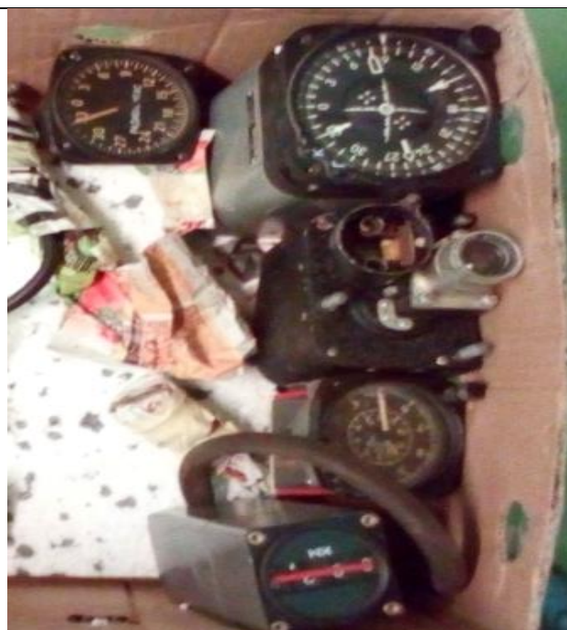
4. Műszer számlap (Ra-226) a