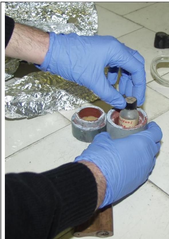
17. Uranil-acetát (U-238) a