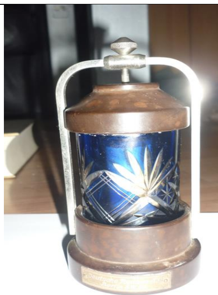
9. Rádiumos „örökméces” (Ra-226) a