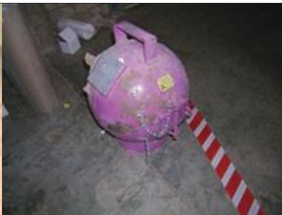
38. Neutron sugárforrás tartó b