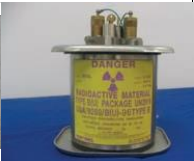
40. Gamma radiográfiai sugárforrás újratöltő (Ir-192) b