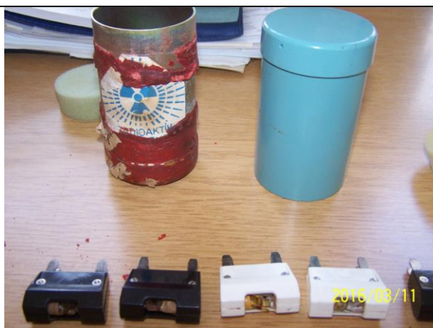
12. Biztosíték (Ra-226) a