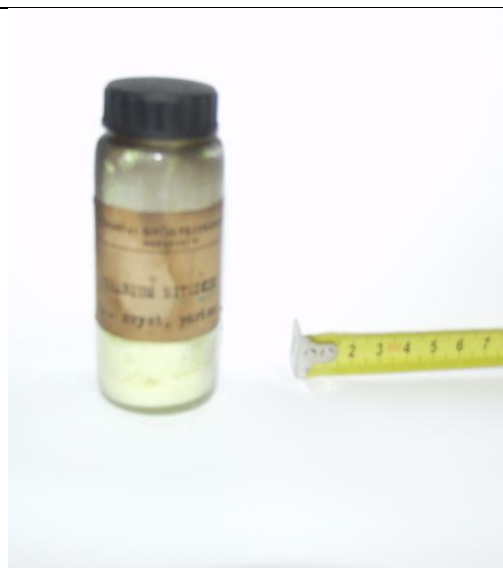
15. Uranil-acetát (U-238) a