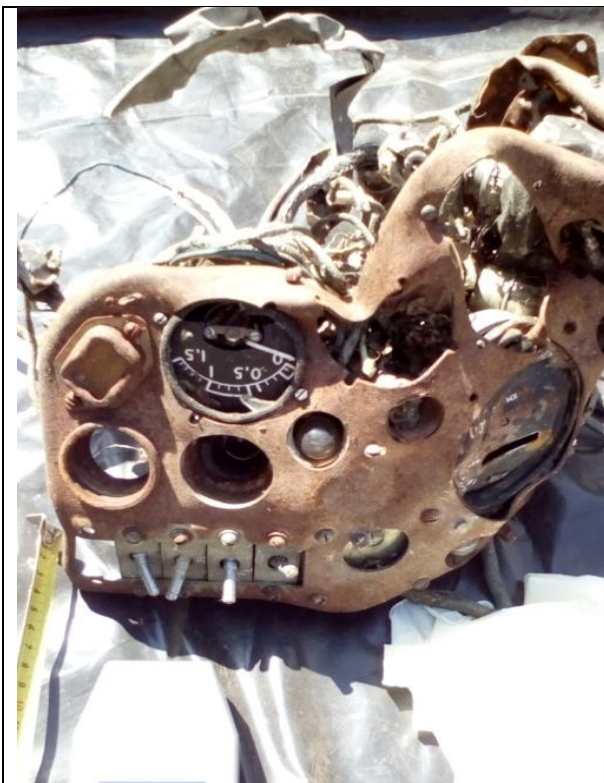
1. Katonai műszerlap (Ra-226) a