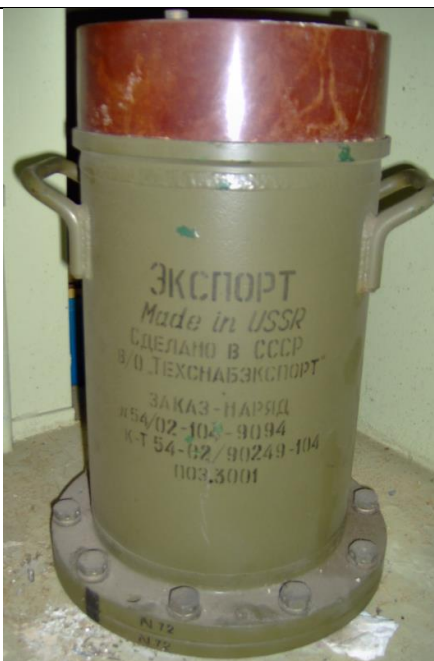
20. Trícialó tartály (U-235) a