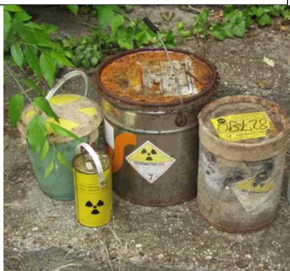
32. Izotóp tartók (Cs-137, I-131) a