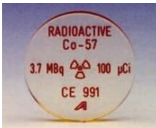
60. Kalibrációs sugárforrás (alacsony aktivitás, Co-57) b