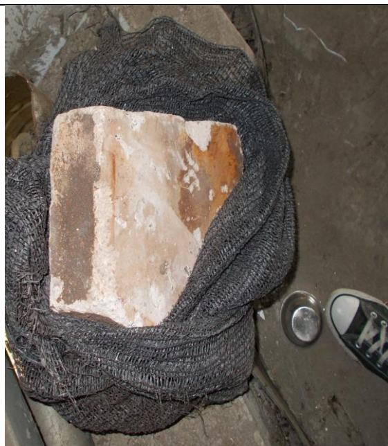
14. Zsalu kő (Ra-226) a