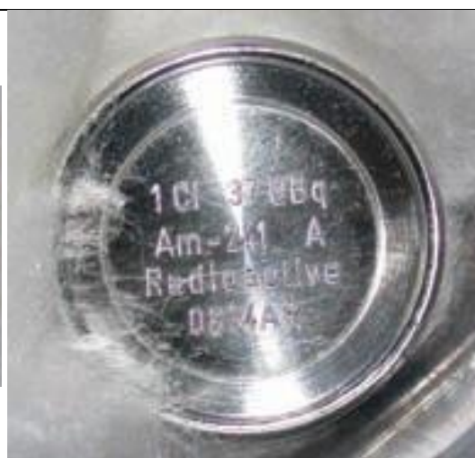
58. Alfa sugárforrás (Am-241) b