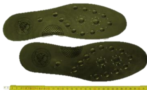
62. Gyógyhatásúnak vélt termék (talpbetét) (Th-232) a