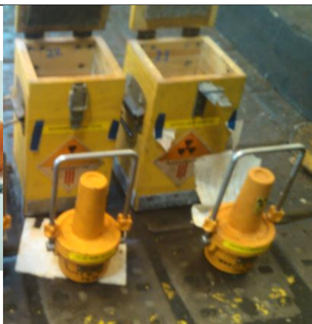
36. Zárt sugárforrás tartó (Cs-137) a