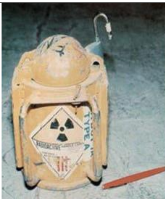
27. Töltésszint mérő sugárforrás tartó (Co-60 / Cs-137) b