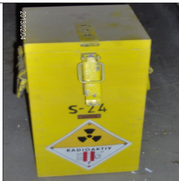
31. Zárt sugárforrás tartó (Cs-137) a