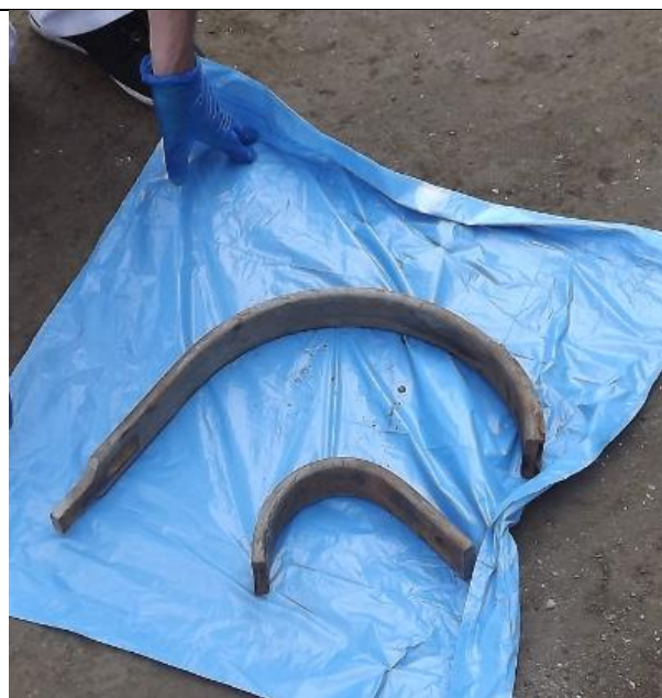
11. Fém merevítő rúd (Co-60) a