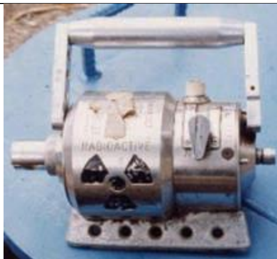
34. Gamma radiográfia munkatartó (Co-60) b