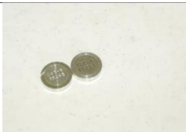
51. Kalibráló forrás (Cs-137 , Sr-90) a