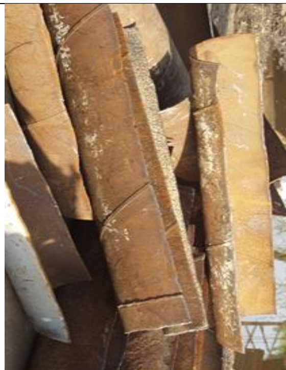
13. Erősen vízköves vascső (Ra-226) a