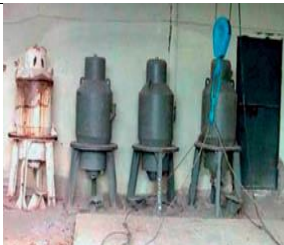
47. Mobil besugárzó (Cs-137) b