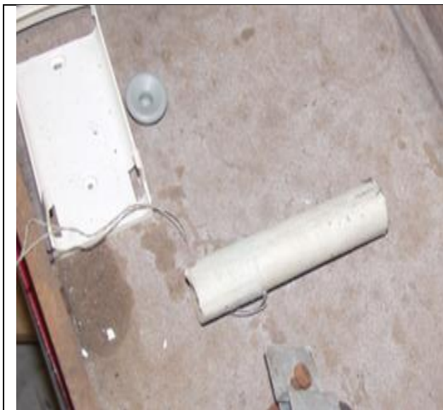
61. Kalibrációs sugárforrás (Ra-226) a