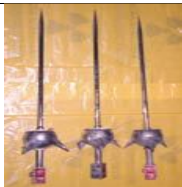
49. Villámhárító fej (Cs-137) b