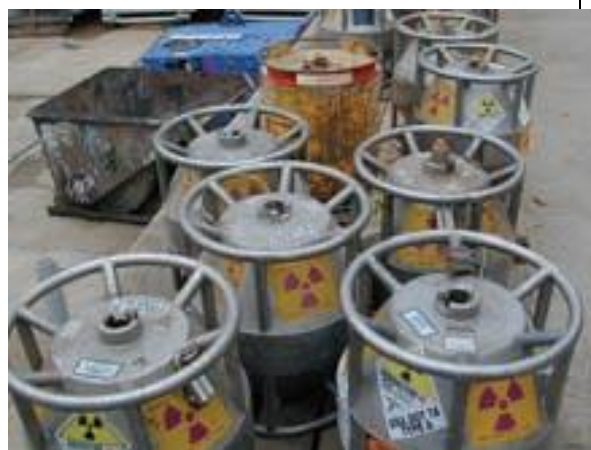
39. Neutron sugárforrás tartó b