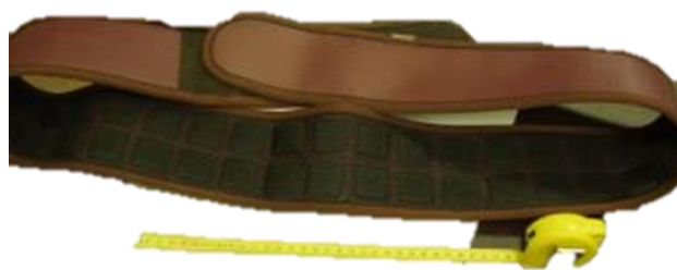
63. Gyógyhatásúnak vélt termék (öv) (Th-232) a