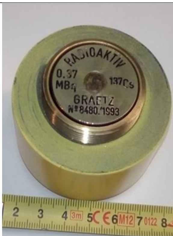
52. Kalibráló zárt sugárforrás (Cs-137) a