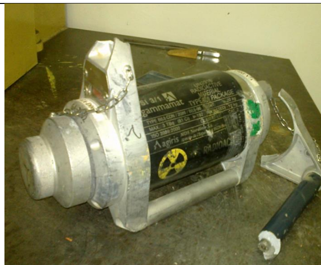
29. Radiográfiai munkatartó (szegényített urán) a