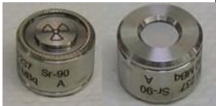
57. Béta sugárforrás (Sr-90) b