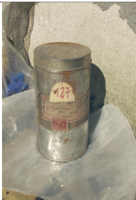
19. Uranil-nitrát (U-238) a