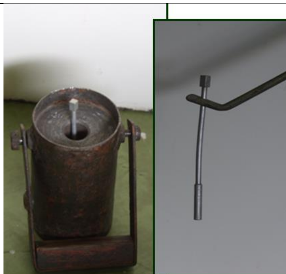
50. Szikra gyűjtő (Cs-137) a