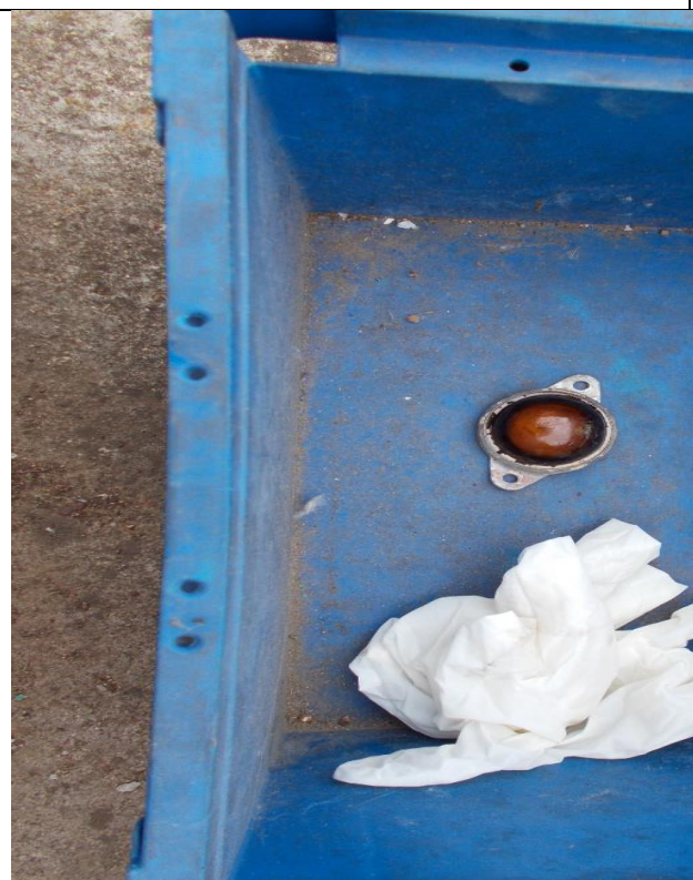
7. Hideg irányfény (Ra-226) a