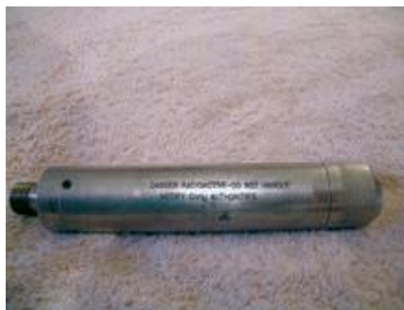
48. Talajszonda sugárforrás (Am-241-Be) b