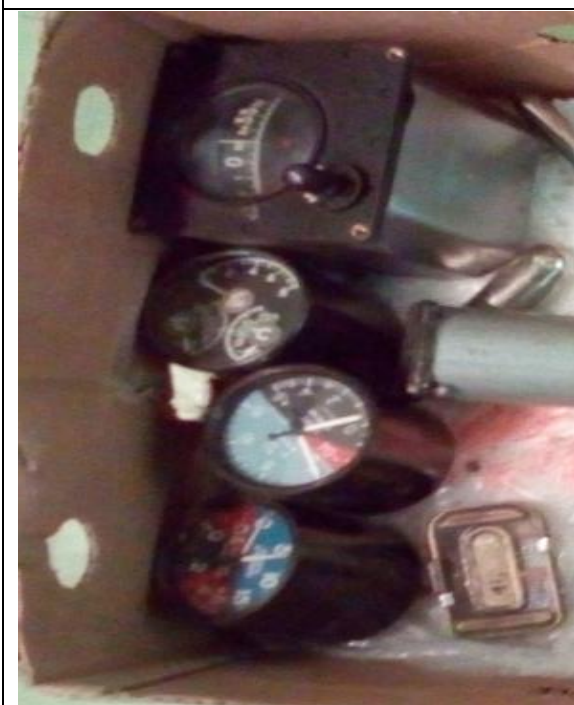
3. Műszer számlap (Ra-226) a