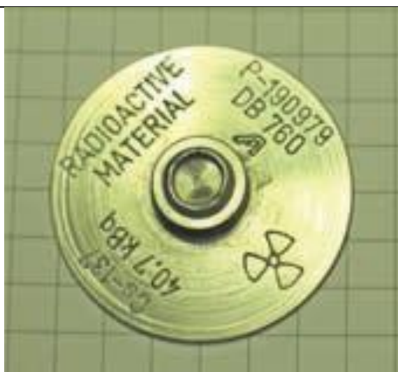
59. Kalibrációs sugárforrás (alacsony aktivitás, Cs-137) b