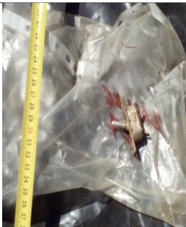
8. Műszerkapcsoló (Ra-226) a