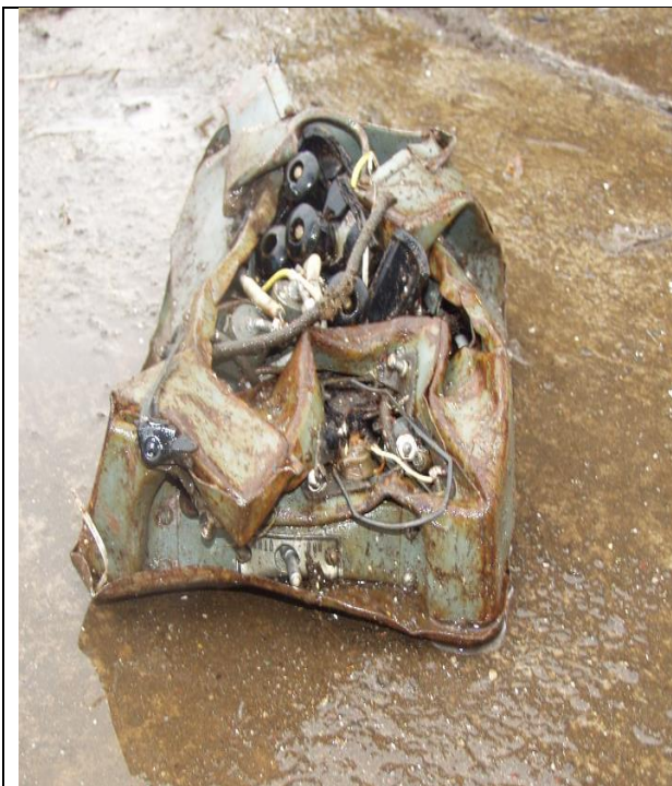
5. Katonai műszerlap (Ra-226) a