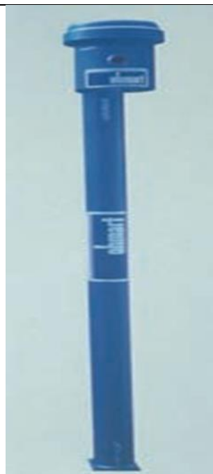
23. Töltésszint mérő vonal forrás (Co-60) b