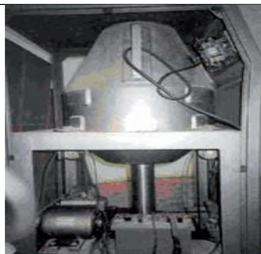
46. Mobil besugárzó (Cs-137) b