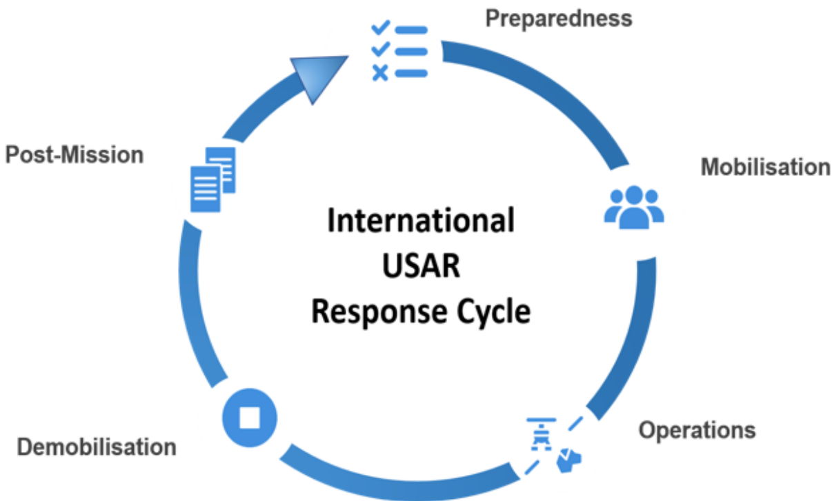
8. ábra : Az INSARAG Nemzetközi USAR válaszingykedési ciklus