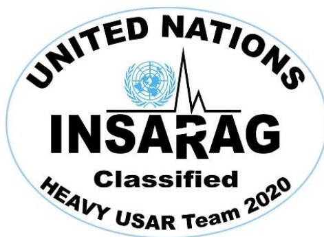
9. ábra : Az INSARAG válljelvény.

„A hatékony és szakszerű nemzetközi segítség biztosítása.”