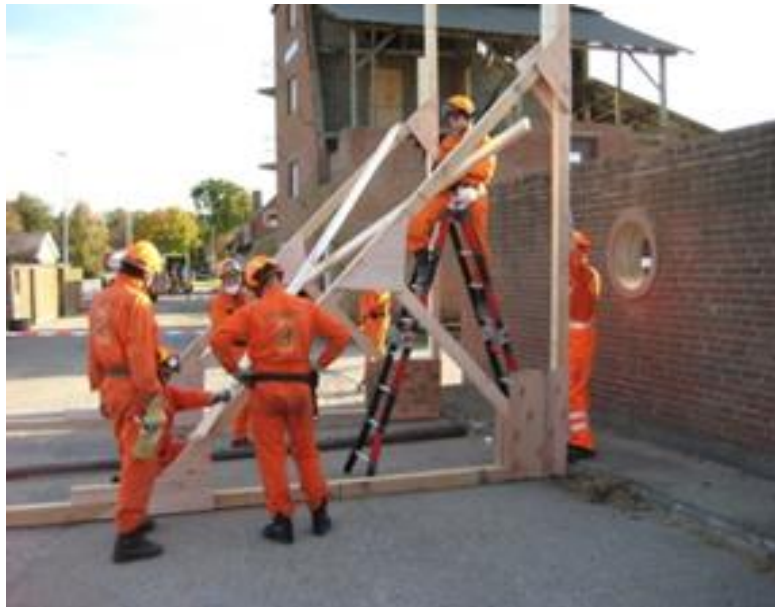
3. ábra : A 36 órás IEC-gyakorlatot végző csapat.