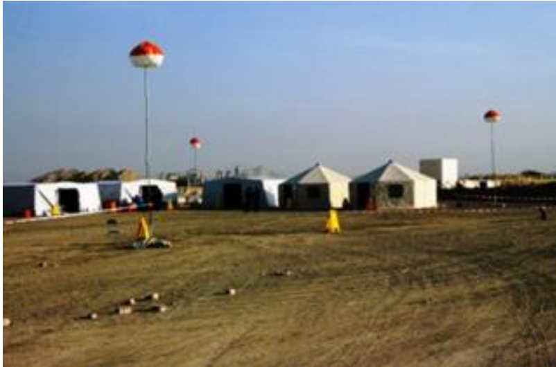
6. ábra : A csapat műveleti bázisa.