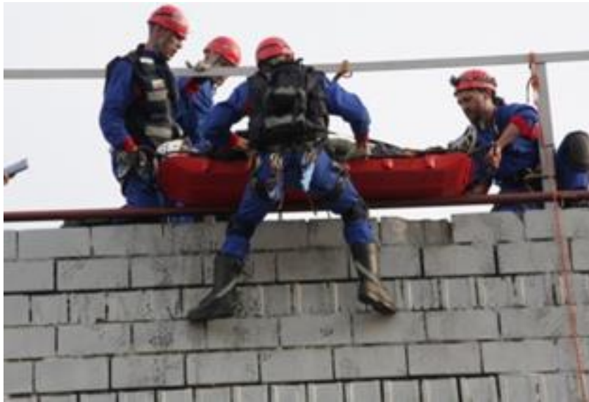
4. ábra : Magasból mentést gyakorló csapat.

A gyakorlatot úgy kell megtervezni, hogy kihasználja épületszerkezetek folyamatosan változó, valóság-hű forgatókönyveit, és nem olyan gyakorlatnak kell lennie, amely bemutatja az egyéni technikai készségeket (a gyakorlat előkészített készség-teljesítmény állomásokon történő rendezése). A szimulált katasztrófyagyakorlatra a nemzetközi katasztrófaelhárítás valamennyi kulcsfontosságú szakaszának átfogására van szükség.