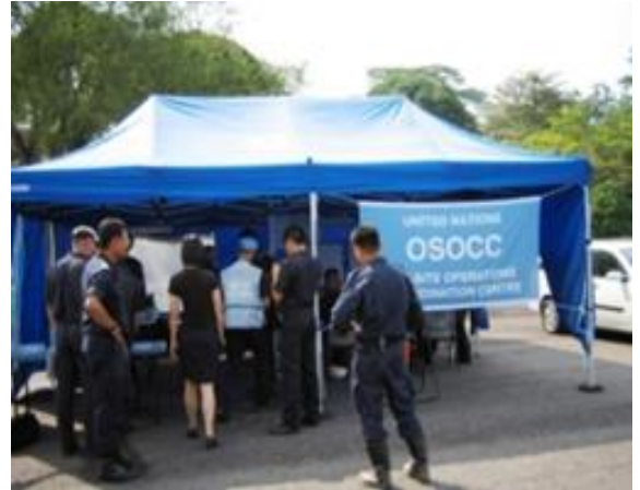
5. ábra : Az IER gyakorlat során létrehozott RDC és OSOCC.